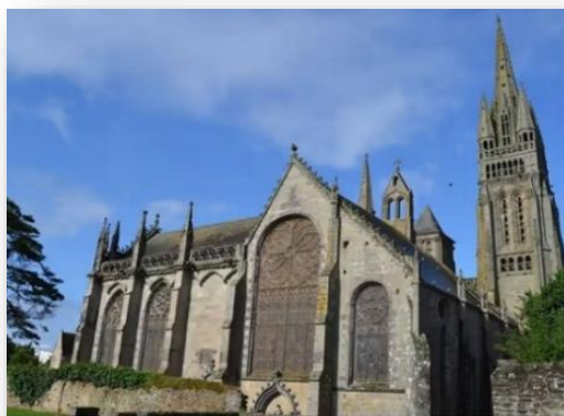
Basilique Notre-Dame du Folgoët

Ensemble, restaurons l'un des joyaux architectural breton !