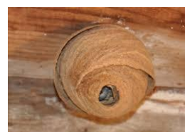
Nid primaire de frelon asiatique

La mairie distribue des pièces à frelons. Les personnes qui n'en ont pas déjà eu peuvent s'en procurer un aux heures d'ouverture de la mairie.