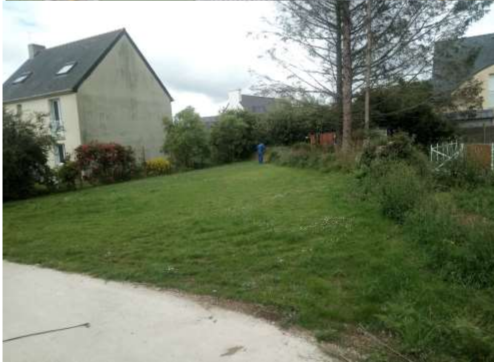
2 – Projet de lotissement communal